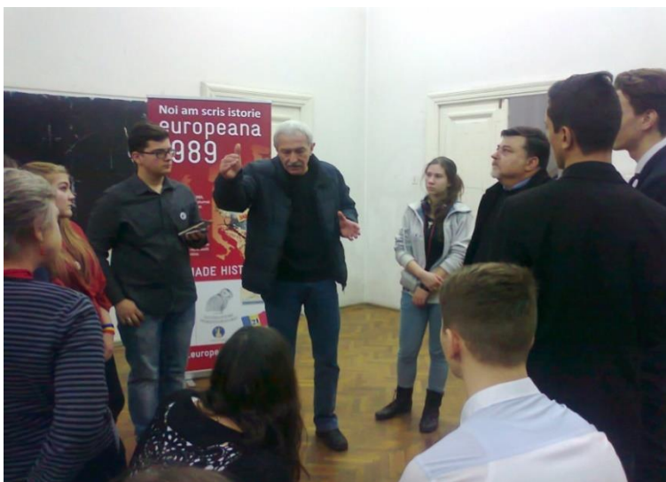
Figura 2. Tineri înregistrând mărturiile unor participanți la Evenimentele din 21 decembrie 1989

În acest mod, întreaga manifestare a avut un aspect educativ pronunțat ce a facilitat schimbul de informații și interacțiunea între generații, tinerii având posibilitatea de a afla chiar de la participanții la acele evenimente ceea ce s-a întâmplat în acele zile, ca și unele detalii mai puțin cunoscute ale atmosferei din acele vremuri.